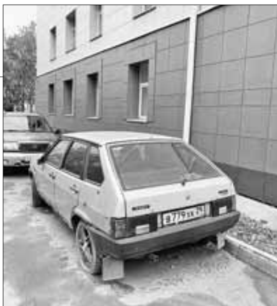
■ Бесхозная «Лада» недалеко от одного из корпусов САФУ, в районе наб. Северной Двины, 12.