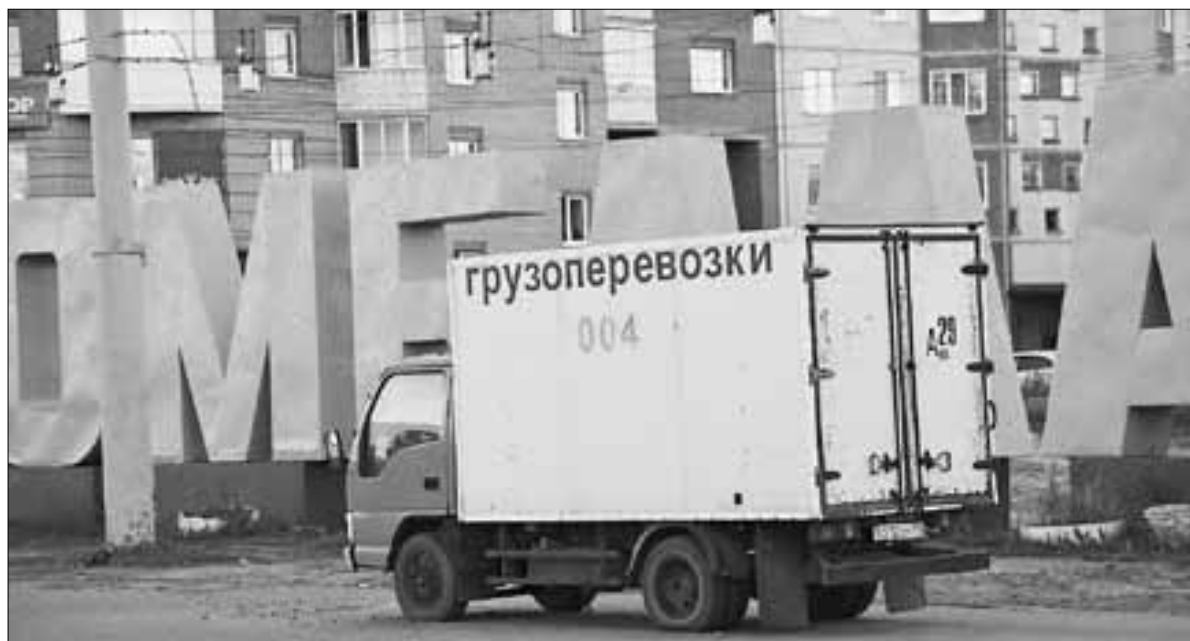
■ Брошенный грузовик уже давно стоит в знаковом месте Соломбалы, но никому до него нет дела.