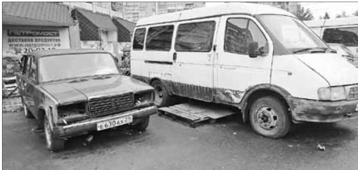
■ У «Диеты» бесхозный автохлам превратился в недвижимость.

Многих интересует: а возможно ли забрать найденный бесхозный автомобиль себе? В региональном управлении МВД говорят, что можно, но после прохождения целой вереницы процедур. Так что, стоит ли овчинка выделки, решать вам.