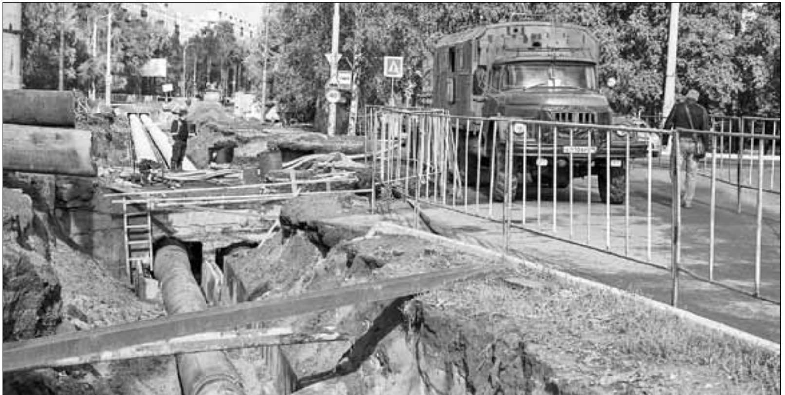
Из-за затянувшихся работ на теплосетях ТГК-2 в районе Обводного канала и улицы Воскресенской более 60 домов Архангельска долгое время оставались без горячей воды.

— Если в течение пяти суток средняя температура воздуха составляет восемь градусов или ниже, тогда тепло подключается. Этот принцип сформировали архангельские теплоэнергораспределяющие организации. На такую температуру ориентируются только на Севере. Контроль начинается в период с августа по сентябрь. Мы, синоптики, среднесуточную температуру считаем так: минимальную и максимальную температуру (измеряется на станции) складываем и делим на два, получаем итог, — рассказала