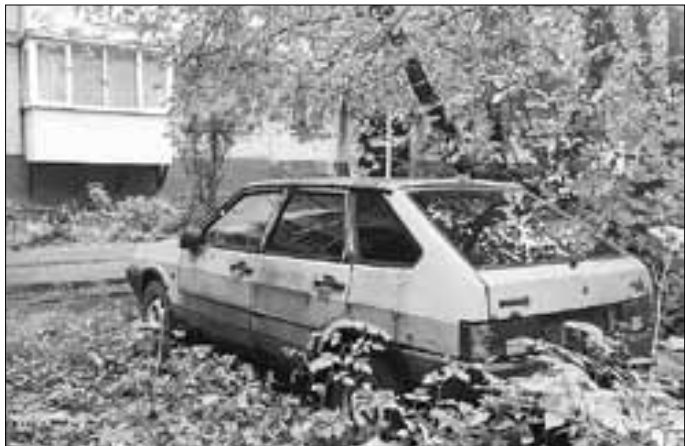
■ Владельца потрепанной «Лады» на ул. Партизанской, 47 жильцы не видели много лет.