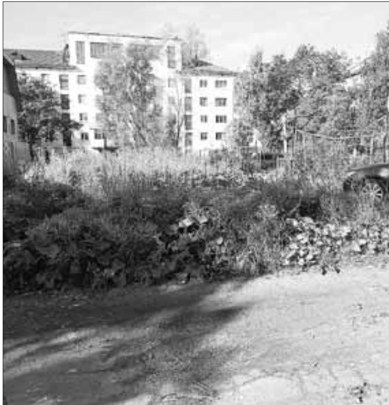
■ Активисты ТОСа «Предместный» уже начали благоустраивать территорию будущего сквера.

– Это единственное такое поле в Соломбале, поэтому за него голосовали. Поначалу у людей были вопросы о доступности, однако сейчас, когда площадка открыта, они убедились, что все жители округа могут ее использовать – здесь играют до позднего вечера. То есть мы обещание выполнили. И новый спортобъект так же будет доступен для всех. Ну и подобных тренажерных площадок в Соломбале больше нет, именно потому люди и в этот раз отдали голоса за нашу