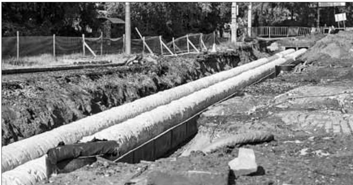
Изолированные трубы меняют на новые участками.