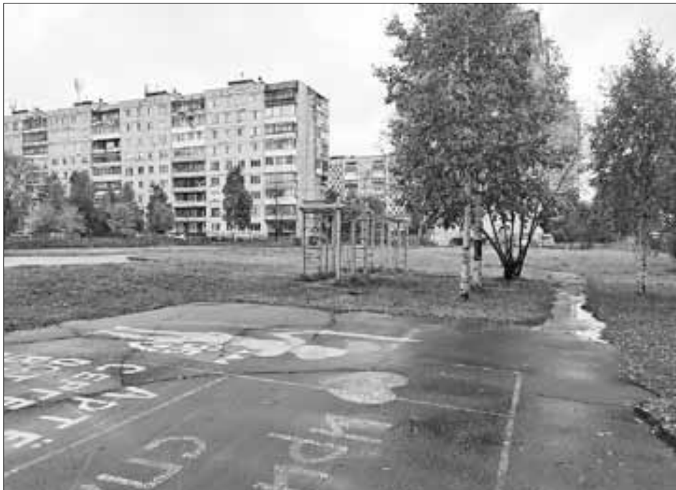
■ На территории школы № 50 появится площадка с уличными тренажерами.

9 023 человек сделали свой выбор в пользу инициативы «Хочешь вырасти? Запомнить просто: ГТО – витамины роста!». На территории школы № 36 на Смольном Буяне планируется установить спортивную площадку, разделенную на уровни, – здесь заниматься физической культурой и вовлекаться в движение ГТО смогут люди разных возрастов. Цена проекта – почти 2,5 миллиона рублей.