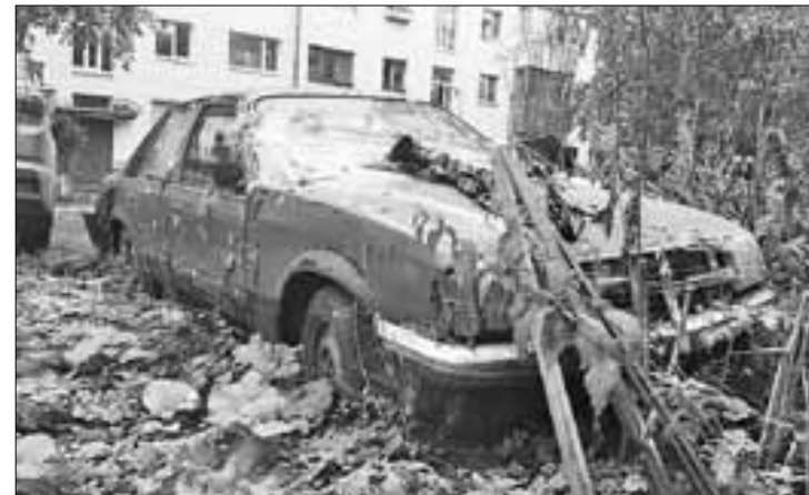
■ Зброшенная легковушка во дворе дома № 14 по ул. Суворова.