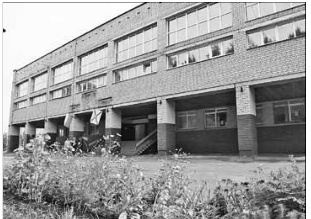
■ Школа № 36 обзаведется новой спортивной площадкой для сдачи норм ГТО.